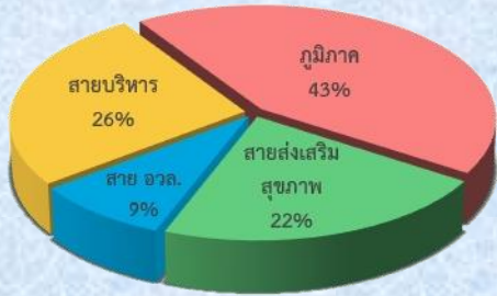
สังกัดหน่วยงาน