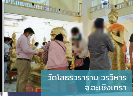
วัดโสธรวราราม วรวิหาร จ.ฉะเชิงเทรา