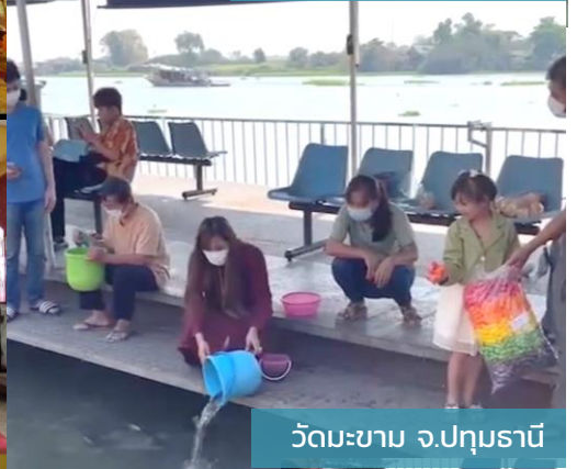
วัดมะขาม จ.ปทุมธานี