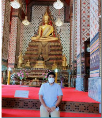
วัดอรุณราชวรารามราชวรมหาวิหาร (วัดแจ้ง) กรุงเทพฯ

กลุ่มพัฒนาระบบบริหาร ส่งเสริมให้บุคลากร “ทำบุญ ตุนความดี” อย่างสม่ำเสมอ โดยหมั่นเข้าวัดและร่วมทำกิจกรรมวันสำคัญทางพระพุทธศาสนา เพื่อให้บุคลากรตระหนักในการทำความดี ขัดเกลาจิตใจให้คิดดี ทำดี พูดดี สามารถนำมาปรับใช้ได้ทั้งในการดำเนินชีวิตประจำวันและการทำงาน อันเป็นการส่งเสริมคุณธรรม จริยธรรมในองค์กร