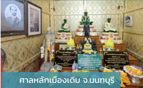
ศาลหลักเมืองเดิม จ.นนทบุรี