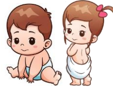
เด็ก 0-2 ปี