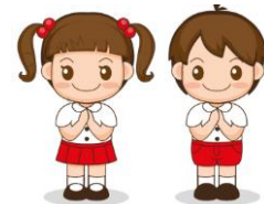
เด็ก 2-6 ปี