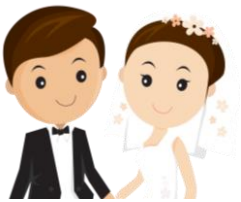
วัยเจริญพันธุ์